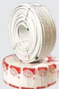
Труба металлопластиковая Coesklima 20 бухта 100 м