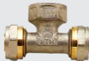
Тройник 16x½" Fx16