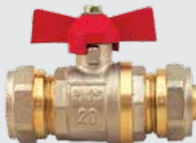
Кран шаровый WING металлопластик 20x20