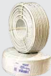
Труба металлопластиковая Рexal 16 бухта 100 м