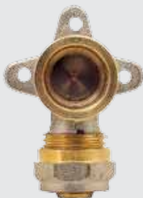
Угол монтажный 20x1/2" F