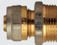
Цанга 16x \frac{3}{4} " M