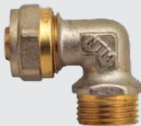
Угол 20x \frac{1}{2} " M