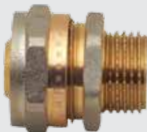
Цанга 20x \frac{1}{2} " M