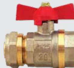
Кран шаровый WING металлопластик 20x¾" F