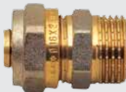
Цанга 20x \frac{3}{4} " M