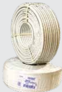
Труба металлопластиковая Рexal 20 бухта 100 м