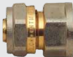
Цанга 26x1" F