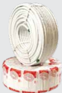
Труба металлопластиковая Coesklima 16 бухта 100 м