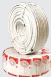
Труба металлопластиковая Coesklima 26 бухта 50 м