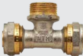
Тройник 16x½" Mx16