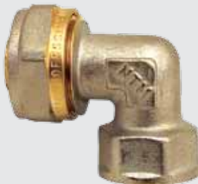
Угол 20x1/2" F