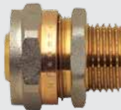
Цанга 26x \frac{3}{4} " M