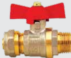
Кран шаровый WING металлопластик 16x½" M