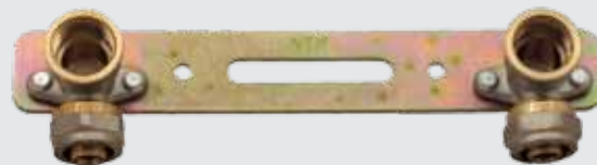
Планка монтажная 16x1/2" F