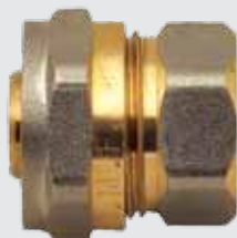
Цанга 26x¾" F