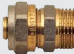
Цанга 16x \frac{1}{2} " M