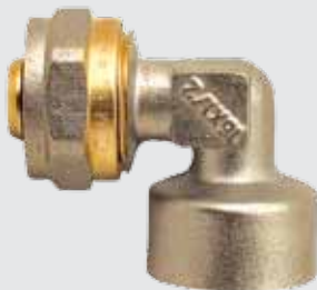
Угол 16x1/2" F