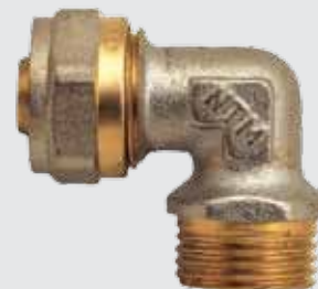
Угол 20x \frac{3}{4} " M