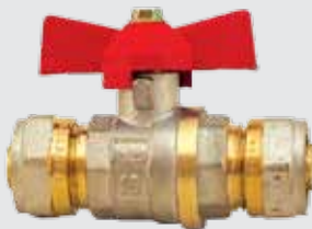
Кран шаровый WING металлопластик 16x16