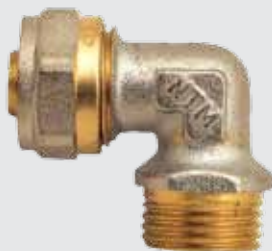
Угол 16x \frac{1}{2} " M