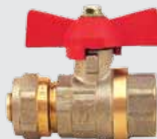
Кран шаровый WING металлопластик 16x½" F