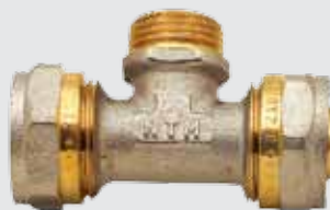
Тройник 26x½" Mx26