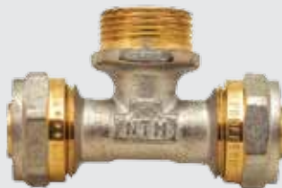
Тройник 20x¼" Mx20